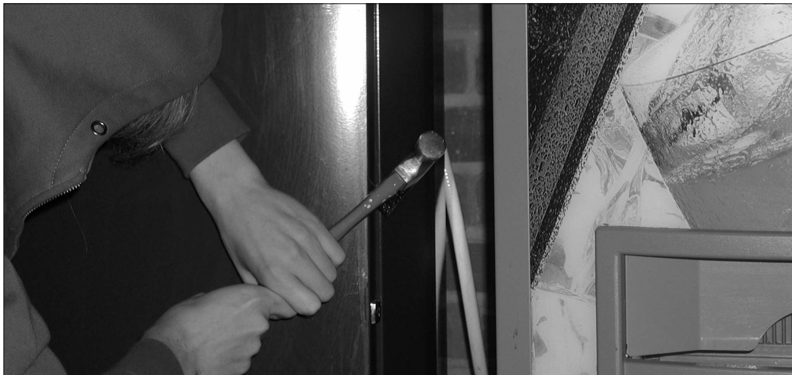
MÅNGA STÖLDER PÅ SKOLAN. Skolans kaffeautomat har blivit uppbruten och behållaren med pengarna försvann. Behållaren hittades senare på handikapptaletten. (Bilden är arrangerad.)