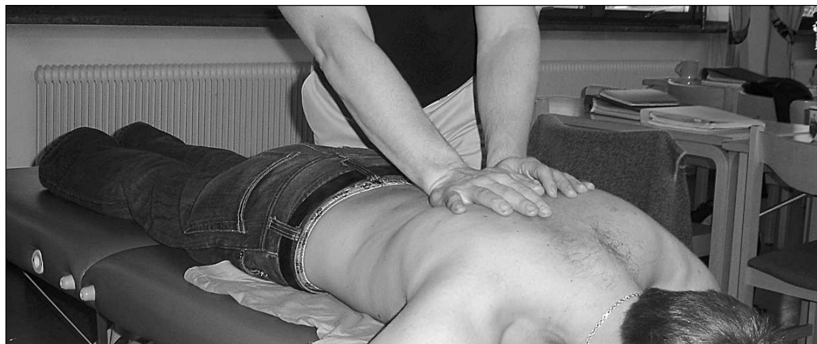
NAKET, KNÅDANDE OCH DOFTFYLLT. En förekommande syn på Södergårds övervåning.