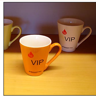
STEG 4: BELÖNINGEN