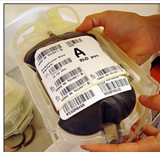
STEG 3: PÅSEN SOM SICKAS TILL LABB.