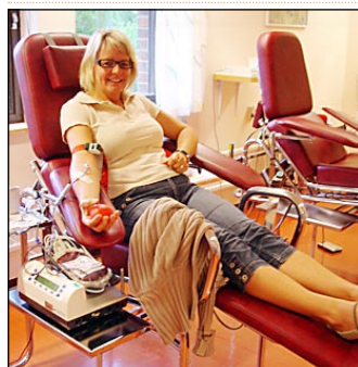
STEG 1: TA PLATS I STOLEN